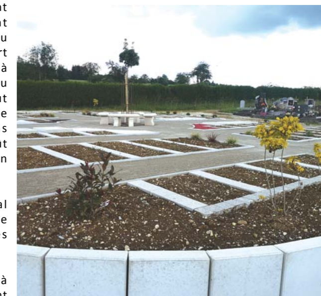
Un nouveau columbarium a été aménagé au cimetière communal.

Signalons qu'une benne à déchets verts a également été aménagée.