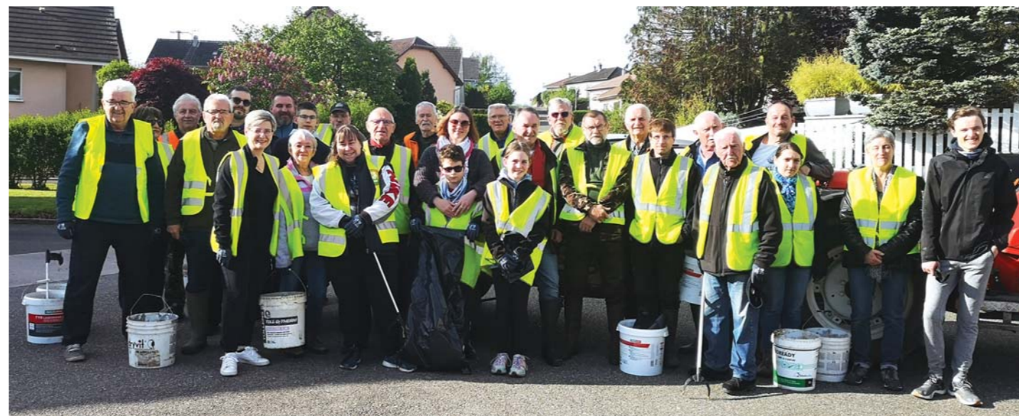
Une trentaine de personnes étaient présentes pour l'édition 2024 du nettoyage de printemps.

Le 4 mai dernier, la commune de Dasle a organisé le traditionnel nettoyage de printemps. Cette opération civique était destinée à effectuer la toilette du village, en ramassant tous les déchets abandonnés çà et là par des citoyens bien indisciplinés.