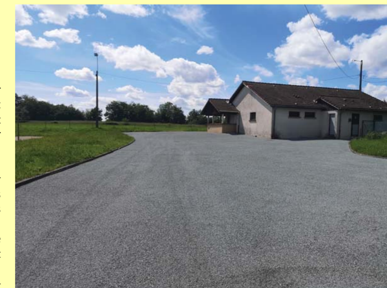
L'entrée du site a été rénovée récemment.

Quelques membres d'associations ont prévu de remettre le bâtiment en peinture (les matériaux seront achetés par la commune) et un nouveau portail sera mis en place à l'entrée, probablement vers la mi-juillet.