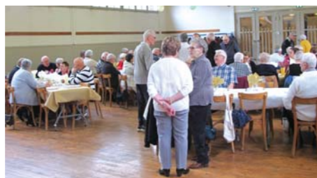
Le 30 mai, le club a organisé un repas sanglier à la broche.

Le comité des Saute-Boyets se réunira prochainement pour établir son programme pour le deuxième trimestre 2024 qui prévoit une sortie à Gérardmer (octobre), une friture (novembre) et le repas de Noël (décembre).