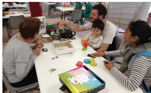
On est venu jouer en famille à la salle Espace-Loisirs.